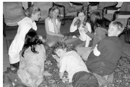
Pace (englisch) bedeutet Schritt. PACE 1 der erste Schritt zur Leiterschaft, ein Schritt in die Verantwortung, ein Schritt in die Zukunft.