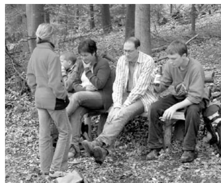
Pace heisst auch Tempo oder Gangart. Der ideale Pace für Jugendliche heisst: Lernen, sich selber zu sein, ohne allein zu sein. So gestalten sie die Gemeinschaft mit, die sie trägt.